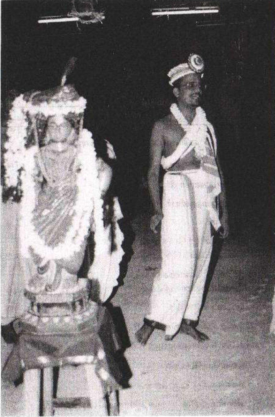
ஐந்தாம் ப்ரஹ்மோத்ஸவ வைபவத்தில், நந்தோத்ஸவம் அன்று, ஸ்ரீ ஸ்வாமிகளின் திவ்யநாம ஸங்கீர்த்தனம்